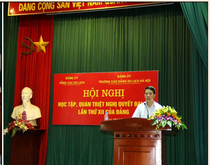
BCH Đảng bộ nhiệm kỳ 2017 - 2022