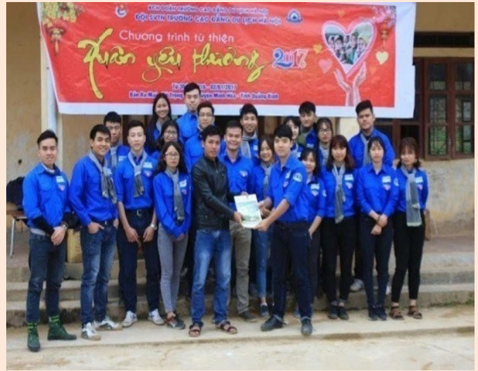
Chương trình từ thiện “Xuân yêu thương” của Đoàn thanh niên Trường CĐDLHN tại Quảng Bình