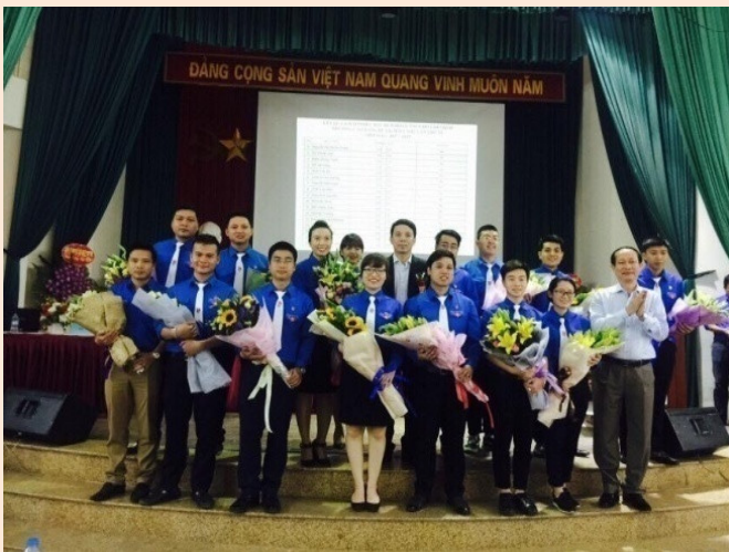
BCH Đoàn TNCSHCM Trường nhiệm kỳ 2017 - 2019