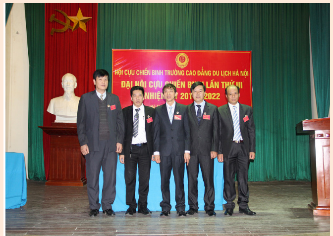
BCH Hội CCB Trường nhiệm kỳ 2017 - 2022