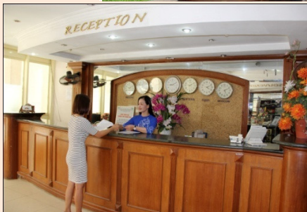
QUẦY LỄ TÂN