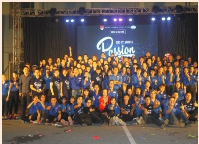
Đêm nhạc hội “Chào tân sinh viên” 2017